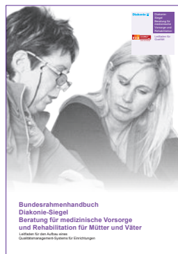
Diakonie-Siegel Beratung für medizinische Vorsorge und Rehabilitation für Mütter und Väter

Diese Zusammenführung von Anforderungen machen die Diakonie-Siegel Bundesrahmenhandbücher zu hilfreichen und unterstützenden Instrumenten der Qualitätsentwicklung.