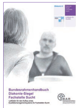
Diakonie-Siegel Fachstelle Sucht