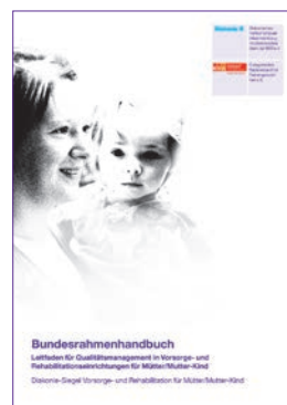
Diakonie-Siegel Vor- sorge und Rehabilitation Mütter/Mutter-Kind