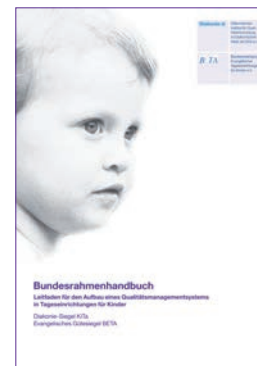
Diakonie-Siegel KiTa/Evangelisches Gütesiegel BETA