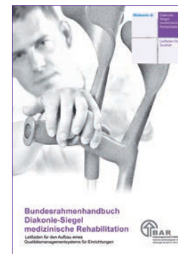
Diakonie-Siegel medizinische Rehabilitation