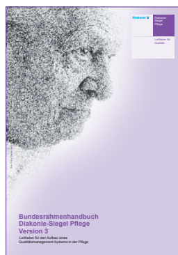
Diakonie-Siegel Pflege Version 3